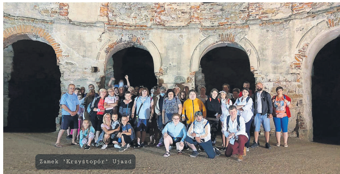
Zamek „Krzyżtopór” Ujazd

Projekt dofinansowany ze środków programu wieloletniego na rzecz Osób Starszych „Aktywni+” na lata 2021-2025