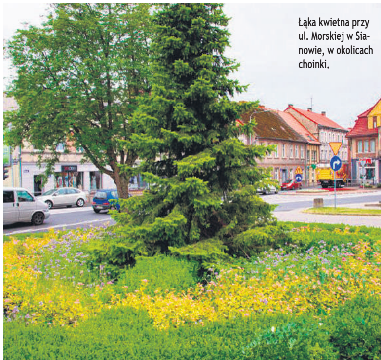
Łąka kwietna przy ul. Morskiej w Sianowie, w okolicach choinki.