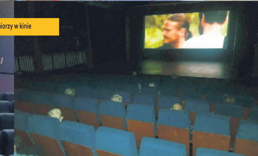
Widowiska w kinie