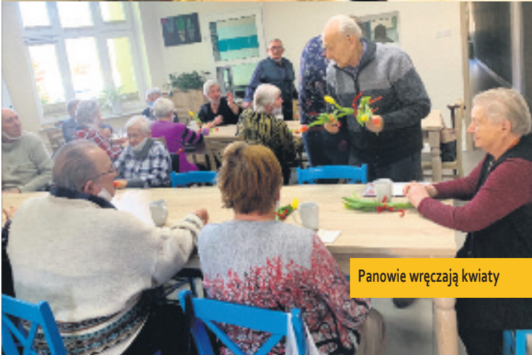
Panowie wręczają kwiaty