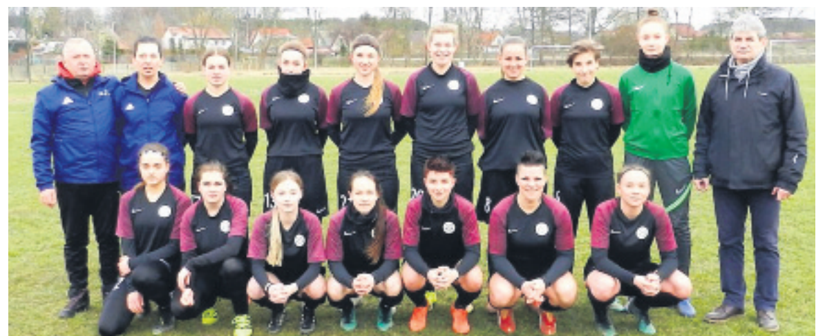
Przed meczem kontrolnym Victorii SP2 Sianów z GOSRiT Luzino.

Następny sparing rozegrały z MKS Lew Łęborck. Piłkarki sianowskiej Victorii SP2 rozegrały naprawdę dobry mecz. Co prawda przegrały 5:6 (4:3), ale trenerzy i działacze sianowskiego klubu byli zadowoleni z występu swoich podopiecznych. Było to ostatnie spotkanie kontrolne przed rozpoczynającą się 27/28.03.2021 wiosenną rundą rewanżową III ligi kobiet sezonu 2020/2021.