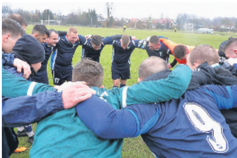
Seniorzy Victorii przed meczem z Gryfem Polanów w Sianowie.