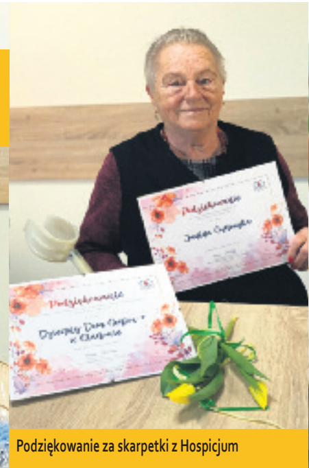
Podziękowanie za skarpetki z Hospicjum