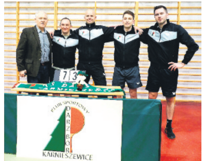
Wzmocniony RLKTS OCHMAN Raszków nie dał rady Naszym

Mecz lepiej rozpoczęli gospodarze. Po czterech grach pojedynczych prowadziliśmy 3:1. W grach deblowych, zespoły podzieliły się zwycięstwami. Po kolej-