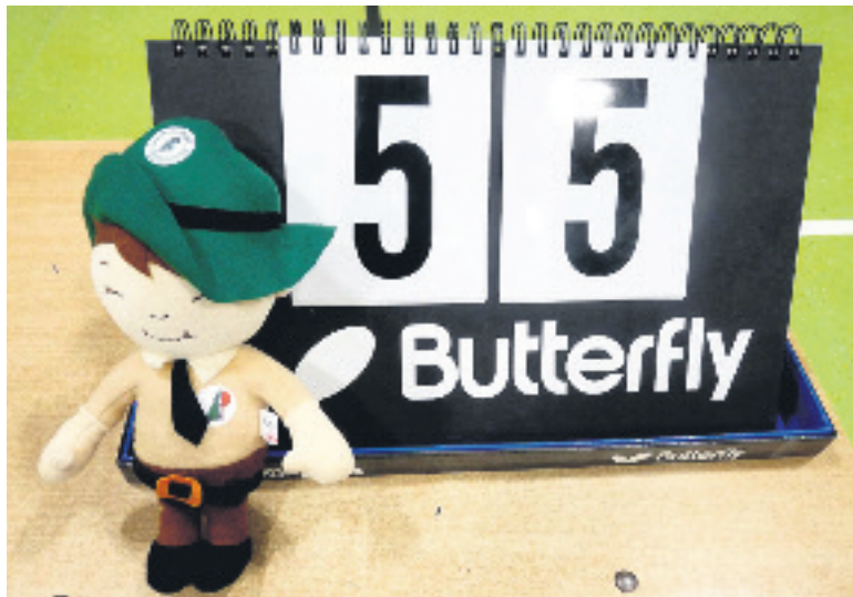
Po meczu z Morlinami Ostróda w Sianowie